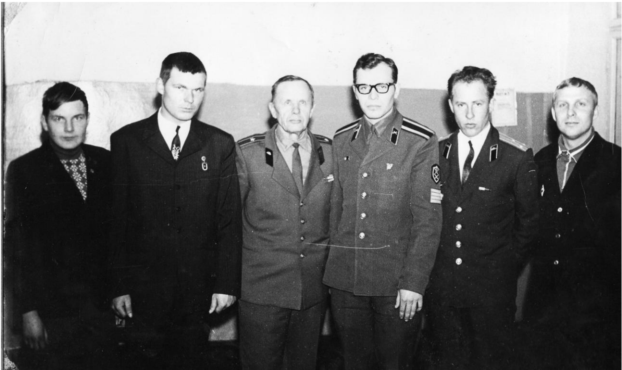
С выпускниками школы.

Контузии и ранения не дали ему долгой жизни. На войне здоровье было потеряно. Он умер в 68 лет. В 1983 году папы не стало.