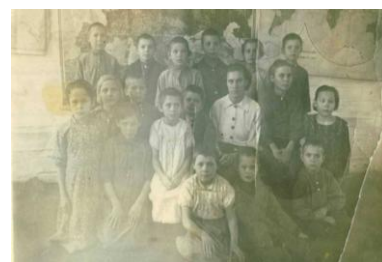
В Лапушках – 2класс

Жизнь продолжается, и, как знать, может и моя внучка или внук в скором времени примут эстафету учительской династии, продолжат хорошее дело, начатое в конце девятнадцатого века.