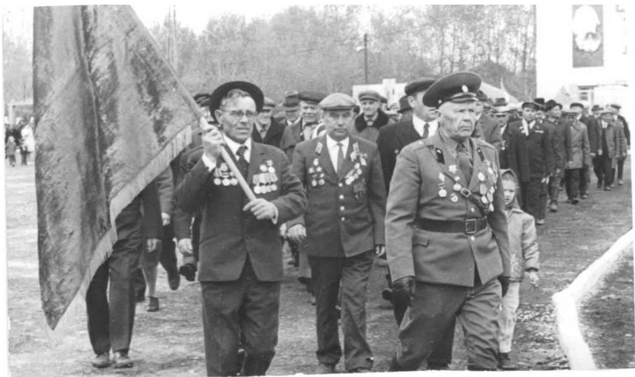
Колонна ветеранов ВОВ (Все ещё живы...)