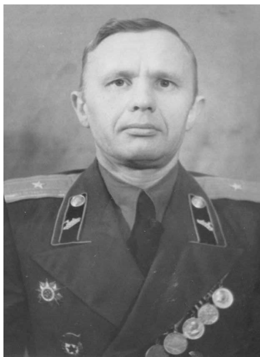
Гвардии – майор.