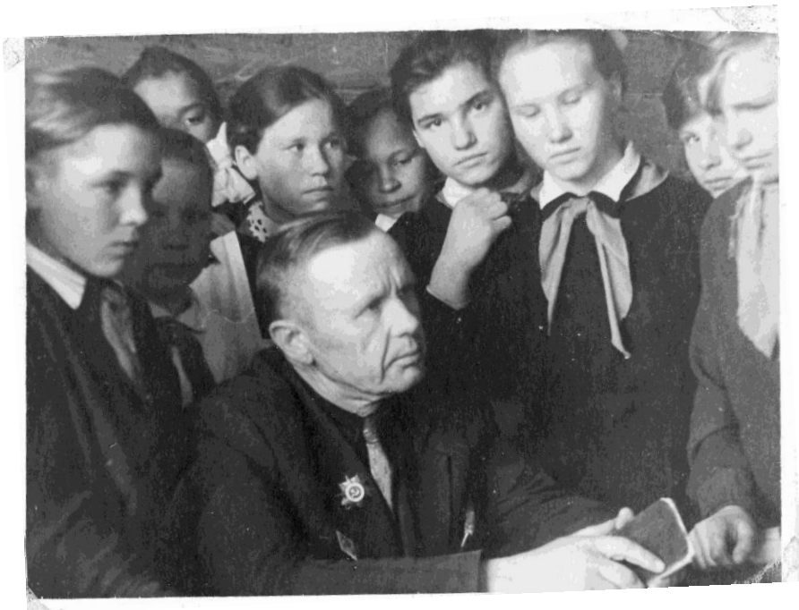
Рассказ о комсомольском билете, 1965 год.