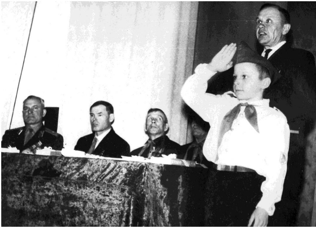
На торжественном пионерском сборе. (60-тые годы)