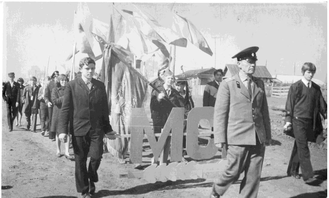
Военрук с учащимися на параде в честь Дня Победы. -1970 год