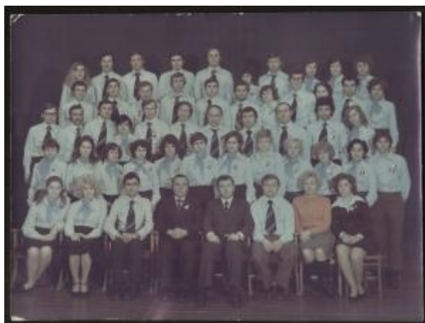
Делегация комсомольцев г. Шадринска на областной комсомольской конференции., 1978 г.