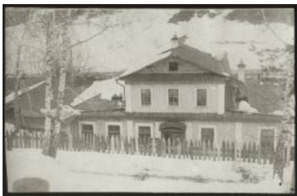
Фабрика «Красный Октябрь»

Быстрый рост сельских комсомольских ячеек требовал создания уездного органа по руководству комсомольскими организациями. В конце октября 1919 г. в Шадринске собирается первое уездное совещание комсомола, где было избрано уездное организационное бюро. Вновь созданный уездный комитет Союза молодежи занимался прежде всего вопросом помощи фронту. В ноябре 1919 г. была объявлена мобилизация комсомольцев, включая и девушек. Шадринская уездная комсомольская организация отправила на деникинский фронт около 300 человек. Оставшиеся в городе и уезде комсомольцы проводили сбор продовольствия, теплых вещей и денежных средств в фонд Красной Армии.