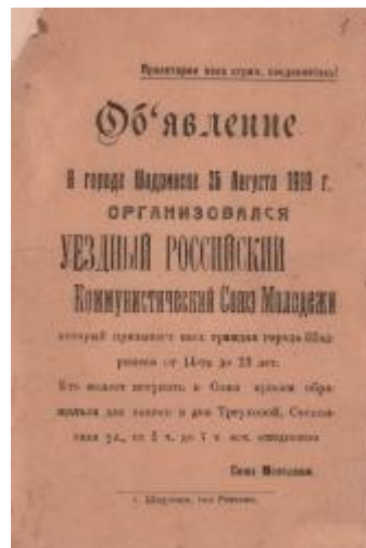
Объявление об организации Уездного Российского Коммунистического Союза Молодежи

История создания Комсомольской организации в Шадринске начинается со второго общегородского митинга молодежи, который состоялся 26 августа 1919 г. Сохранился документ, напечатанный на небольшом листке: «Объявление. В городе Шадринске 26 августа 1919 г. организовался Уездный Российский Коммунистический Союз Молодежи, который призывает всех граждан города Шадринска от 14-ти до 23 лет. Кто желает вступить в Союз просим обращаться для записи в дом Треуховой, Соснинская ул., от 5 до 7 ч. Ежедневно. Союз Молодежи». [3, Л. 1].