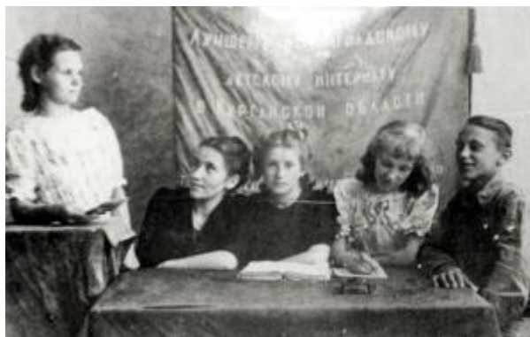
Члены комитета комсомола Ленинградского интерната, эвакуированного в г. Шадринск, 1944 г.

Комсомольцы города в годы войны самоотверженно работали у станков, выдавая продукцию для фронта и тыла, в неурочное время изготавливали инструмент для МТС, помогали колхозам проводить работы, дежурили в госпиталях, создавали тимуровские отряды, помогая семьям фронтовиков. [5, Л. 21-25].