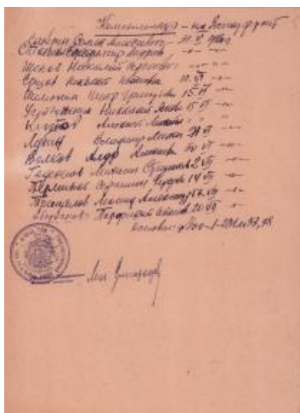
Список комсомольцев, отправленных на западный фронт

Но с уходом на фронт сотен комсомольцев, комсомольская организация не уменьшилась, а увеличилась, лишь изменился её состав. Приехали тысячи