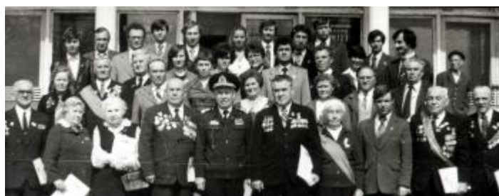
Ветераны комсомола с комсомольцами города - 60 лет Шадринскому комсомолу, 1979 г.

В 2018 г. комсомол празднует 100-летний юбилей. В историю Шадринской комсомольской организации вписано немало имен. Многие из них стали Героями Советского Союза и Социалистического Труда, учёными, мастерами искусств, военачальниками, дипломатами, политическими, государственными и общественными деятелями, олимпийскими чемпионами. Вклад молодежной организации в становление экономики страны, защиту рубежей, восстановление народного хозяйства, строительство важнейших объектов огромен.