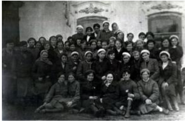
Группа шадринских комсомолок, девушек-добровольцев, перед отправкой на фронт в мае 1942 г.

трудящихся с эвакуированными заводами и фабриками. Шадринские комсомольцы, которых еще не брали в армию, пошли на заводы. Лучшим юношеским бригадам присваивалось звание фронтовых. К июлю 1944 г. в городе было около 200 комсомольско-молодежных бригад, в которых работали 1300 юношей и девушек. [2, Л. 45].