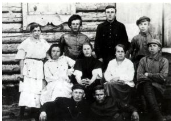
Комсомольцы перед отправкой на фронт

22 июня 1941 г. началась Великая Отечественная война. 23 июня вышел экстренный номер газеты «Путь к коммуне», в котором была опубликована информация о митинге трудящихся города в горсаду и его резолюция: «Все, как один, встанем на защиту Родины». В первые же дни войны 2300 юношей и девушек Шадринска подали заявления в военкомат с просьбой отправить их на фронт. На защиту Родины тогда ушли 700 молодых людей, в том числе 135 девушек. Комсомольцев среди ушедших 662. [6, Л. 59].