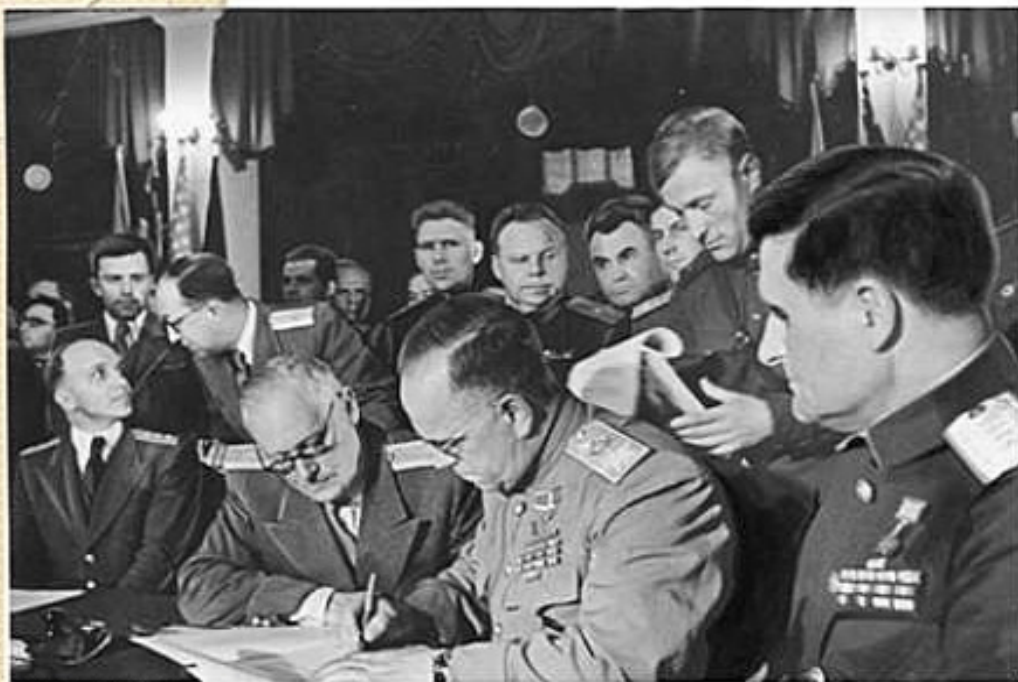
Bundesarchiv, Bild 153-P02000