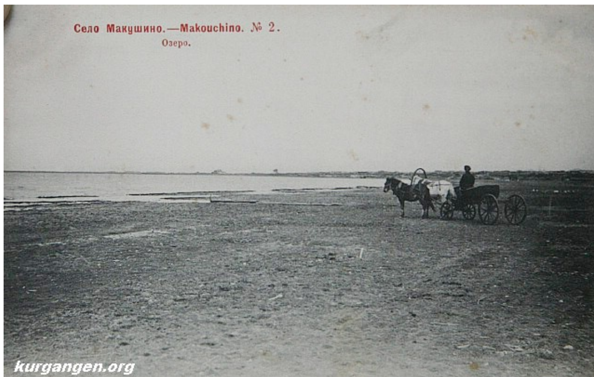
Фото села Макушино.

В ревизской сказке 1812 года записано: «Вновь заведенная деревня по удобности хлебопашества и сенных покосов при Макушинском озере. Переведен Указом Тобольской казенной палаты в 1797 году из Ялуторовского округа.