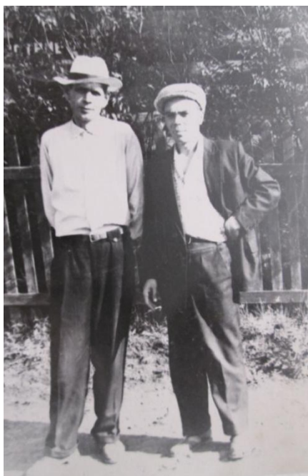
Директор автохозяйства (1967- 1973 г.г.)