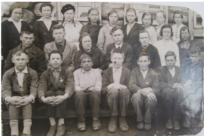
16 мая 1939 года 7 класс с. Лапушки

Украинский фронт. Особо запомнился маме более продолжительный период работы в военном госпитале в городе Мукачево Закарпатской Украины. Ну и конечно победа, долгожданная победа, которую молодой девчонкой мама встретила в столице Венгрии Будапеште!!!