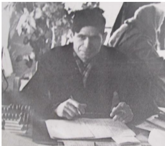
Экономист (1962 г.)