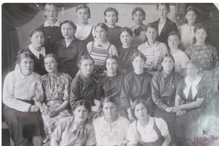
Обучение в Курганской медицинской школе (1940-1941г.г.)