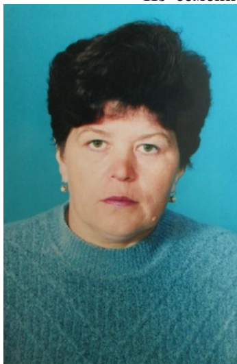
Из семейного архива Мурнаевой Н.Н.