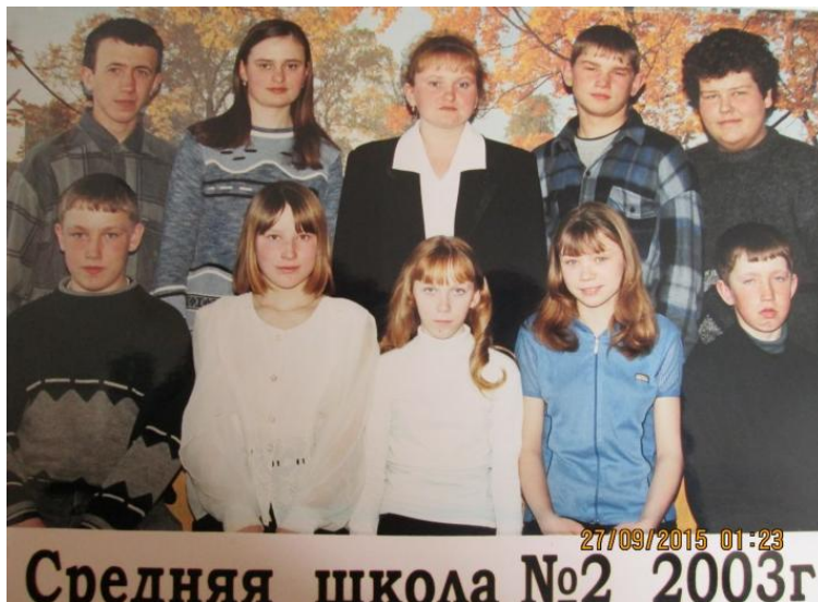
Молодой классный руководитель

С 2015г. работает воспитателем в детском саду г. Сургута ХМАО.