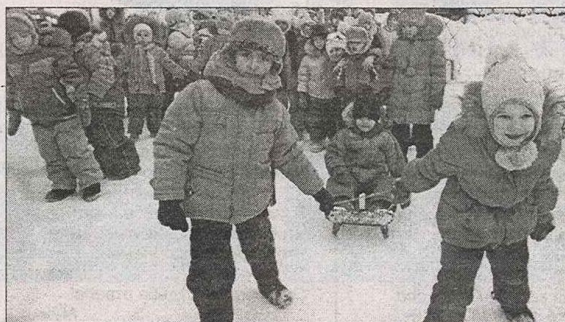
На старт! Внимание! Марш!

Ходят с шайбой, ходят с клюшкой. Ждет успех их, ждет рекорд, Смотрят с завистью игрушки На спортивных дошколят.